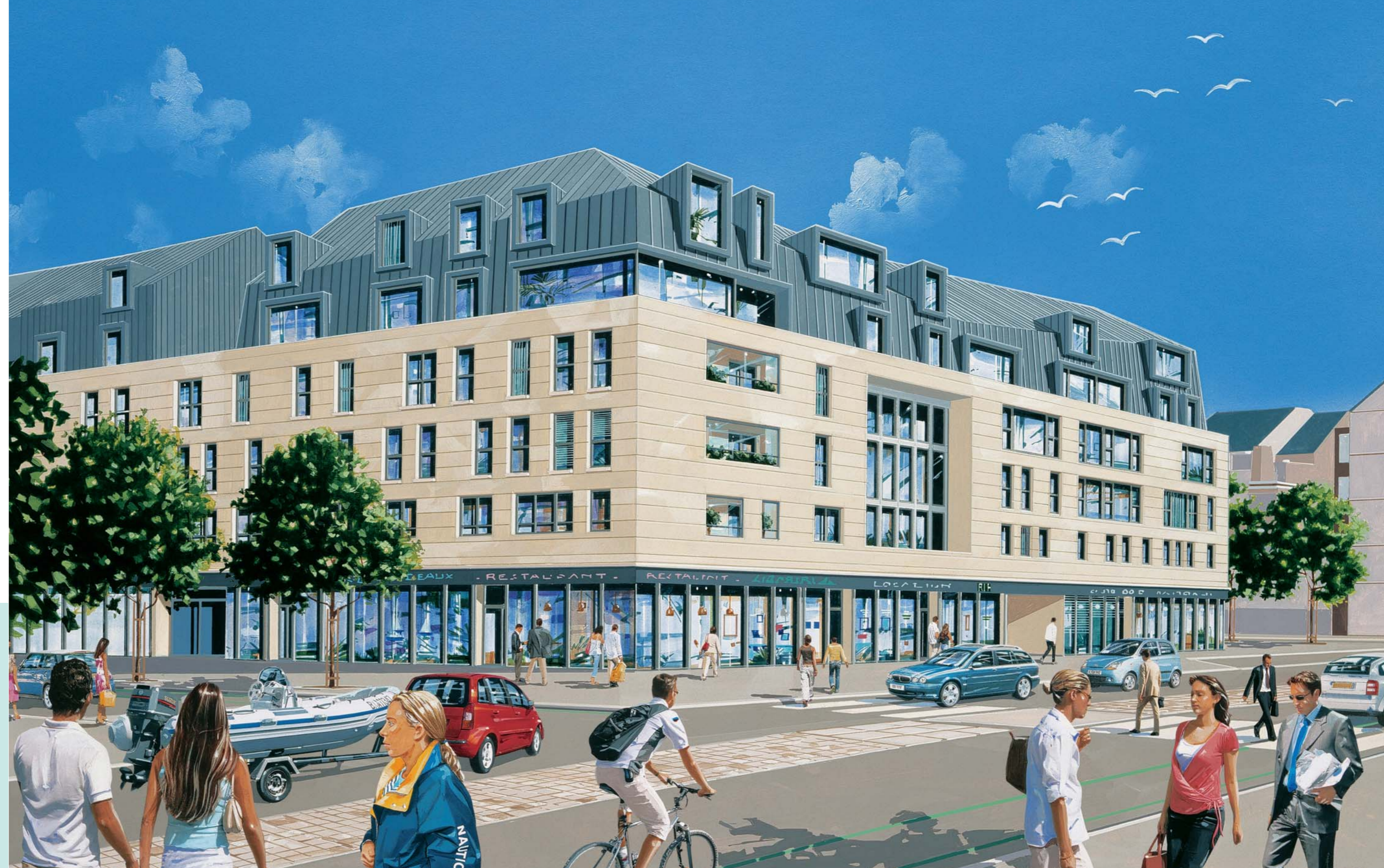
Newquay, vue de la Résidence et des commerces sur l'axe Moka/Marville.

Vous contribuez à la préservation de notre planète en appliquant et en relayant les bonnes pratiques environnementales.